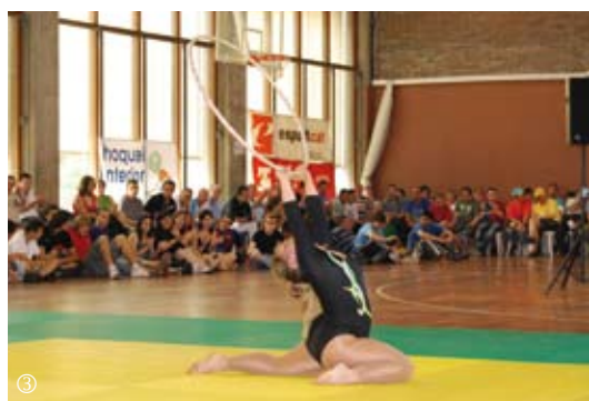
1.- Les autoritats van manifestar el seu compromís amb la Federació i el moviment Special Olympics Catalunya. 2.- Les famílies van acompanyar els esportistes a la cloenda del curs acadèmic. 3.- Exhibició de gimnàstica artística.