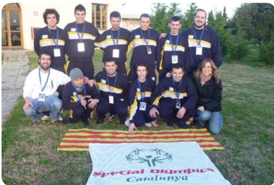
La delegació catalana que va participar al I Gran Prix Special-Meeting Internazionale Special Olympics Itàlia de Futbol Sala Unificat.

Special Olympics Catalunya va ser convidada al I Gran Prix Special-Meeting Internazionale Special Olympics Italia de Futbol Sala Unificat, els dies 17, 18 i 19 de desembre, a l'illa de Sardenya. El C.E Ziga-Zaga de Valls, va ser l'encarregat de representar els colors de Catalunya.